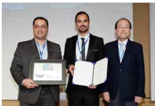
Nilfam Engineering Co.(イラン)