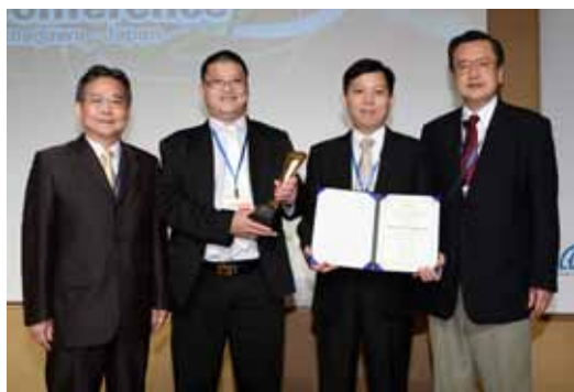
Taiwan Color Optics,Inc.(台湾)